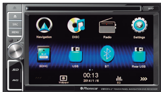
La nueva unidad multimedia VM039 cuenta con navegación iGo Primo, DVD y microprocesador 800MHz Dual Core.