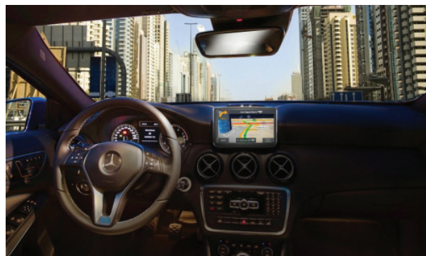
Ejemplo de instalación de una unidad VM075 en un Mercedes, su modelo OEM de referencia.

conducir que abren aún más el abanico de posibilidades de negocio y de expansión. Sorprendente es su nueva gama de sensores para el aparcamiento (productos con la referencia 6/921) y las variadas retrocámaras, casi todas ellas personalizadas y adaptables a diferentes marcas de vehículos, con funcionalidades tan prácticas como la luz infrarroja de la VM268 . También en el segmento de las cámaras se mueve su unidad deportiva VM294 , útil para todo tipo de vehículos (bicicletas, motos, co-