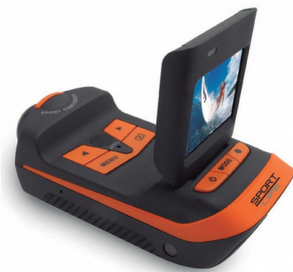
Entre las novedades del catálogo multimedia de Phonocar encontramos la cámara de acción VM294.

Conscientes de todo el potencial que se despliega ante las multinacionales del multimedia, en Phonocar han creado toda una serie de productos complementarios a la experiencia de