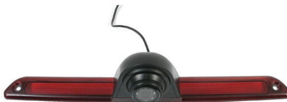
La cámara de aparcamiento VM268 está específicamente diseñada para la furgoneta Volkswagen Sprinter.